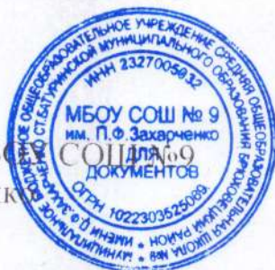
И. Н. Лебедь